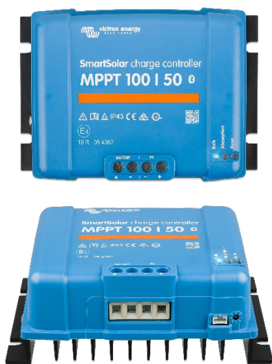
Contrôleur de charge SmartSolar MPPT 100/50