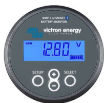
Détection Bluetooth BMV-712 Smart Battery Monitor