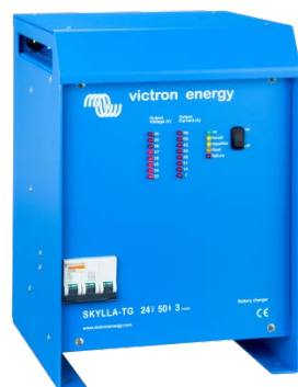
Skylla TG 24 50 3 phase