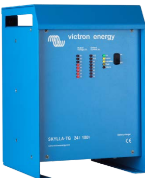
Skylla TG 24 100