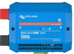
Lynx Smart BMS 1000 A