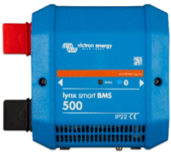
Lynx Smart BMS 500 A