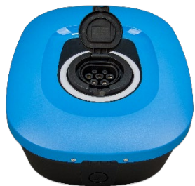
EV Charging Station NS- Avant